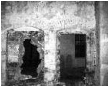
Durchlässe vom Pfarrsaal zum Kreuzgang