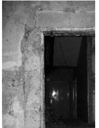
Blick vom Pfarrsaal in Richtung Sakristei

Weiterhin wurden Fragmente von Wandbemalungen freigelegt, deren Deutung es weiterer kunsthistorischer Untersuchungen bedarf. Die unerwartet reichhaltigen Ergebnisse der denkmalpflegerischen Untersuchung rechtfertigen nach Meinung aller Beteiligten die mehrwöchige Verzögerung der Bauarbeiten. Mit Spannung kann man der Dokumentation zum fünfshundertjährigen Kirchenjubiläum im Jahr 2011 entgegen sehen.