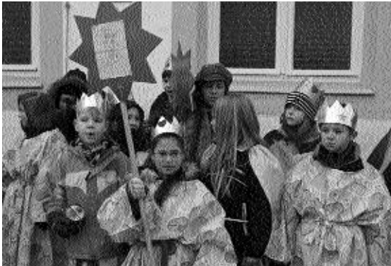
auf dem Klosterplatz