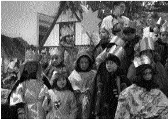
vor der Krippe in St. Jodokus