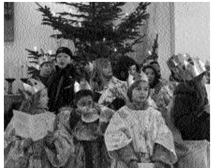
in der Andreas-Kapelle