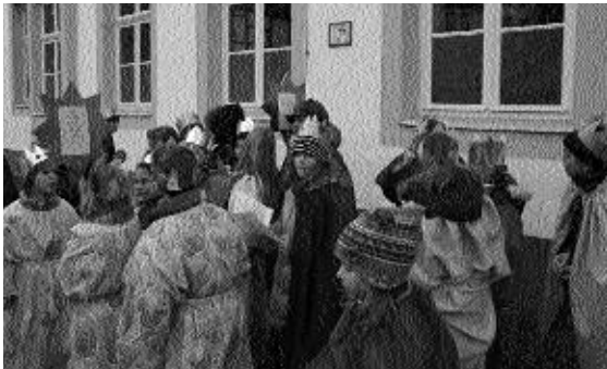
unterwegs in die Stadt