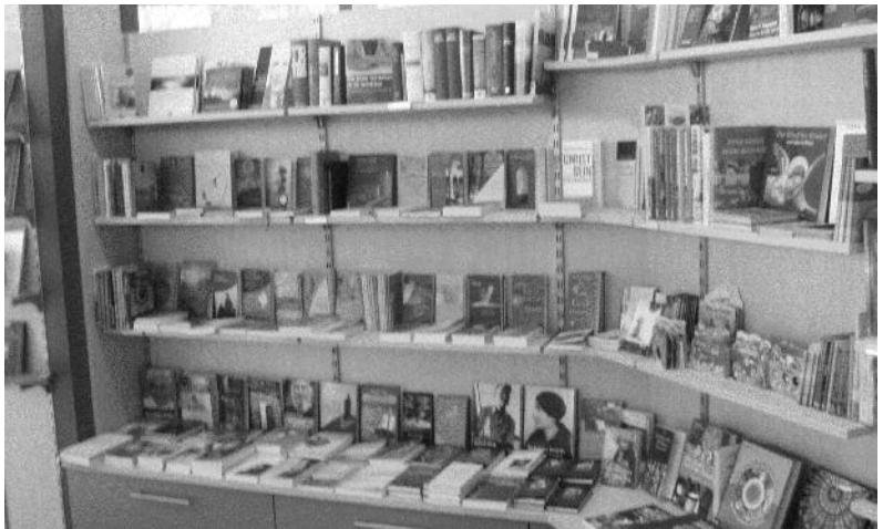
Bücherei St. Jodokus

Ihren Kindern einfach vorbei und überzeugen sich selbst. Für den Herbst dieses Jahres planen wir, Ihnen Hörbücher, die neue Art der Literatur, anzubieten. Ein Besuch der Kath. Öffentlichen Bücherei von St. Jodokus ist immer ein Gewinn, für Sie und für das Büchereiteam.